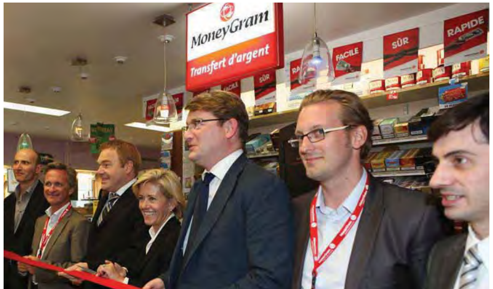
Inauguration du 200 000 e point de vente MoneyGram : Le Tabalire .